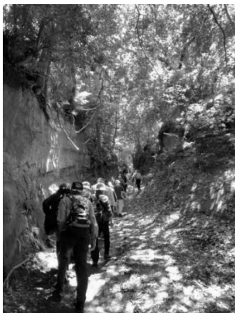
切通を元気に歩く会員